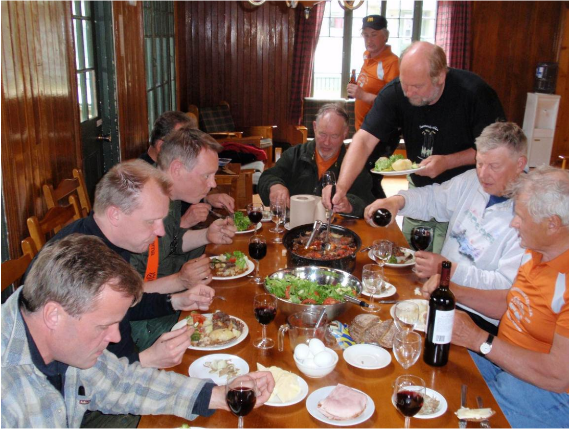
Raskas jahti vaatii raskaat eväät ja raakaaineet löytyvät aiheen piiristä. Metsästyspäivien normaaliruokaa oli neljäntoista karhun sisä- ja ulkofilettä samassa ateriasa.