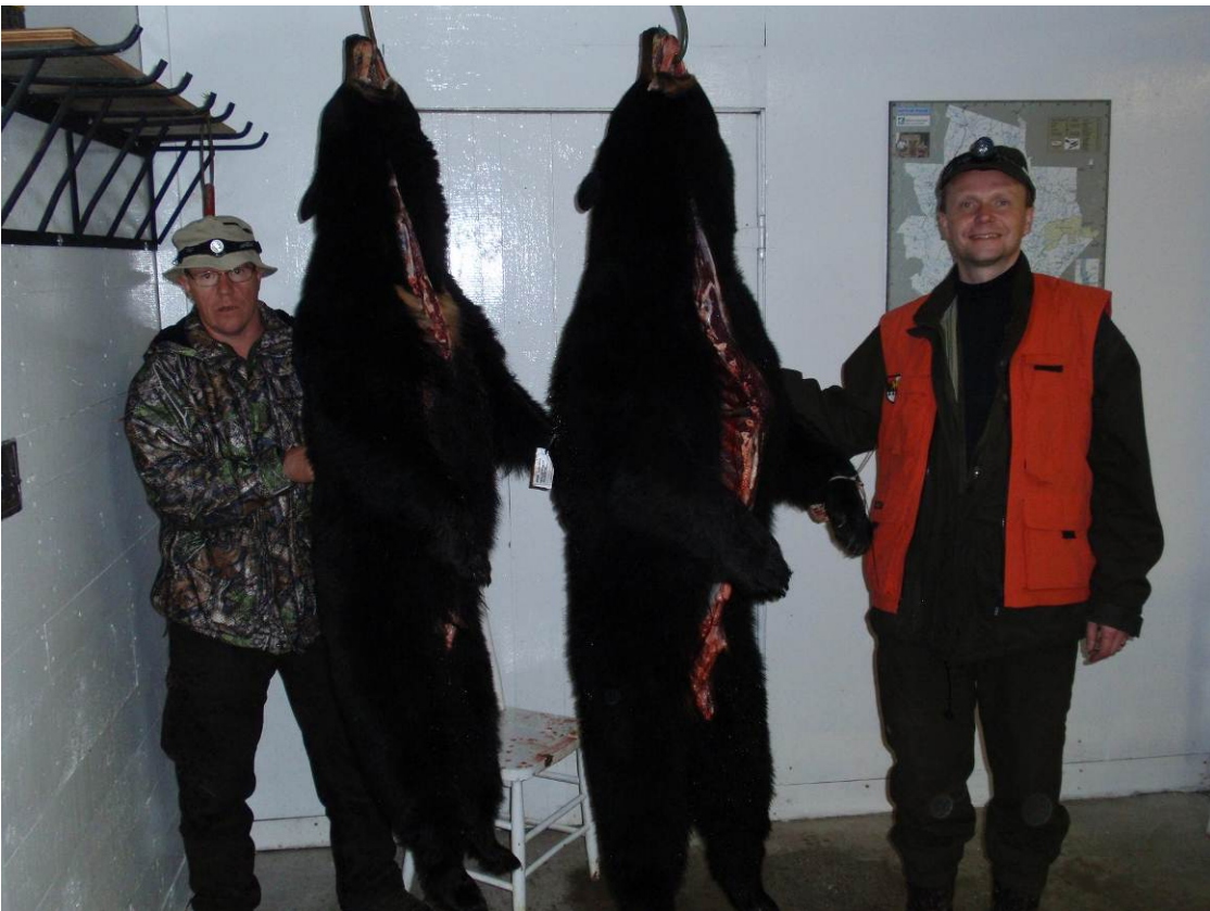
Eka illan karhut.