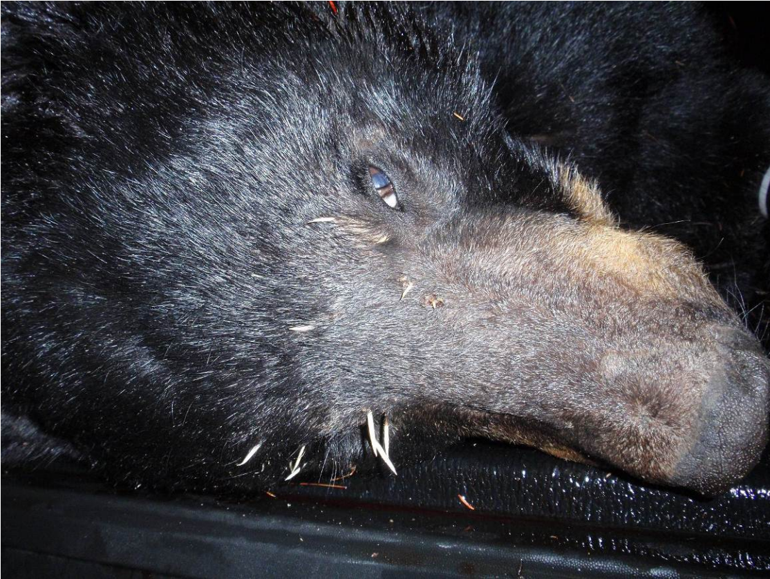
Karhun naama piikkisian kohtaamisen jäljiltä.